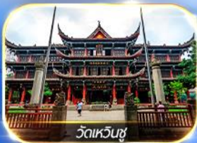
วัดเหวินชู่