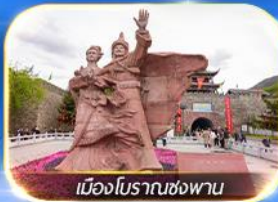
เมืองโบราณชงพาน