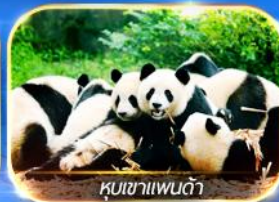
หุบเขาแพนด้า

สัมผัสความงามของธรรมชาติ 2 อุทยาน อุทยานจิวจ้ายโกวและอุทยานน้ำแข็งต้ากู่ นั่งรถไฟความเร็วสูง ชมความน่ารักของน้องหมีที่หุบเขาแพนด้า ซอปปิงที่ไถ่กู่หลี่ ดูแพนด้ายักษ์ป็นตึก